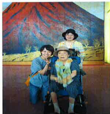
ホテルのロビーで記念撮影